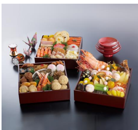
* 画像は、2014 年新春提供のおせちです。

アゴーラは、今後も株主様のご期待にそえるよう各事業に邁進するとともに、新たな挑戦に積極的に取り組み、株主様のご要望にお応えする優待制度を提供していきます。