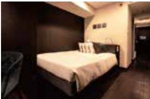
스탠다드 더블 (욕조 포함)