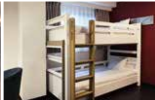
스탠다드 2층 침대