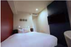
스탠다드 세미 더블