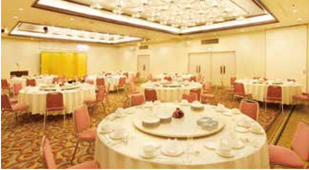
2F Royal Prince

우아한 시간을 보내는 연회부터 캐주얼한 파티까지 여러분의 니즈에 맞는 서비스를 제공합니다. 또한, 연회장 외에 4개의 미팅룸이 준비되어 있습니다.