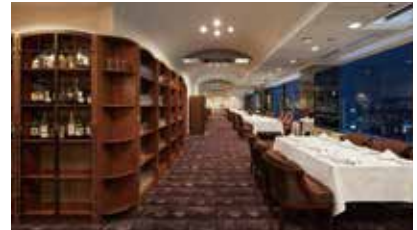
12F Sky Banquet